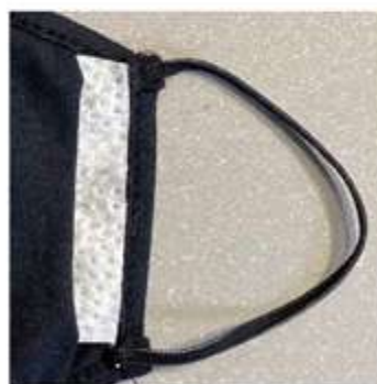
Dettaglio filtro estraibile