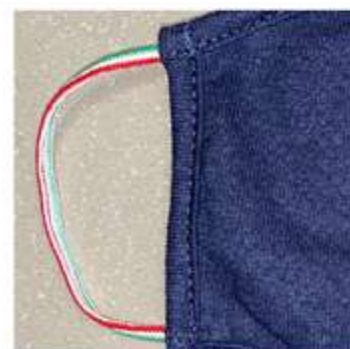
Dettaglio elastico tricolore variante Navy