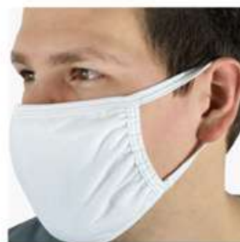
Dettaglio elastici mascherina