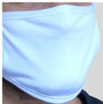
Dettaglio parte frontale